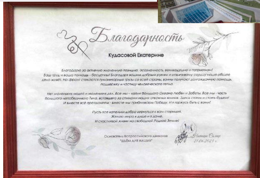
Благодарственное письмо главы, март 2023